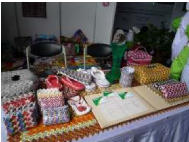
展示包装纸循环再利用产品